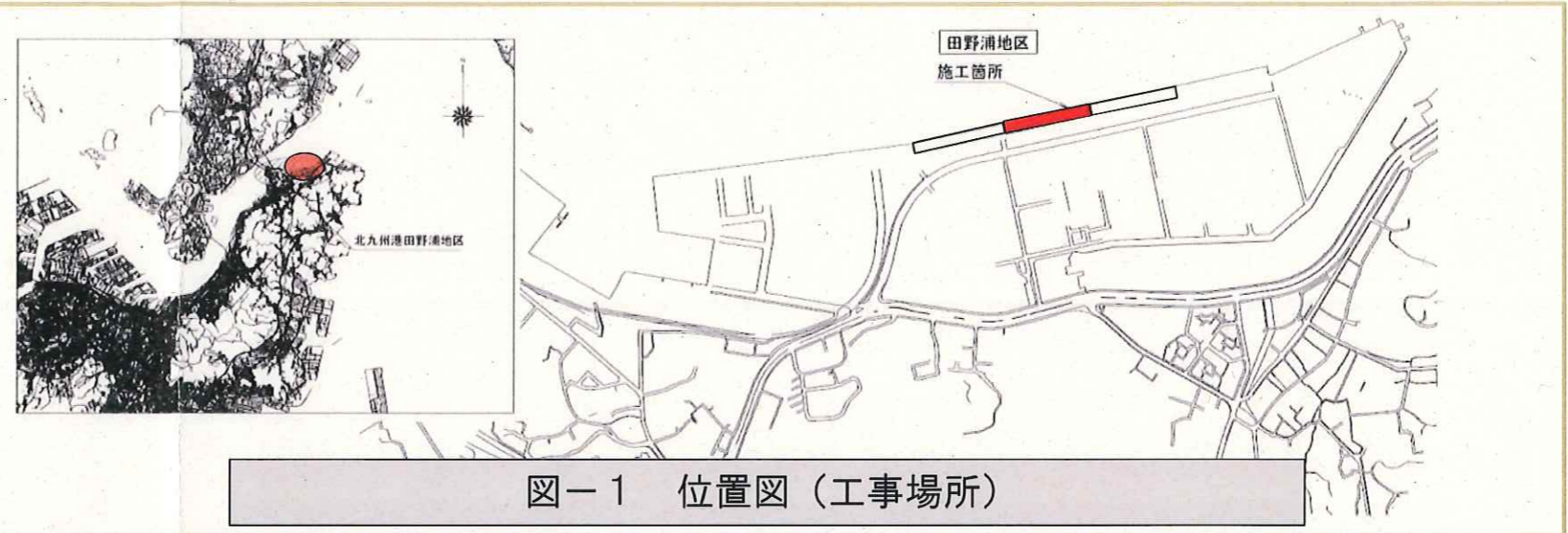
図-1 位置図(工事場所)