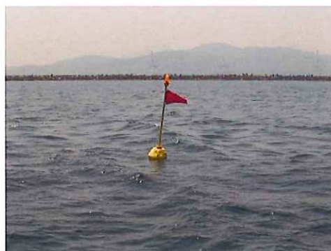
写真-1 ブイ設置状況