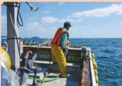
1人乗り漁船で漁業を行っている者