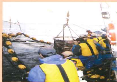
1人乗り以外の漁船で漁業を行っている者

船室内に乗船している者や潜水漁業を行うために必要な措置（ウェットスーツ着用等）を講じている者等は、ライフジャケットの着用義務を負いません。