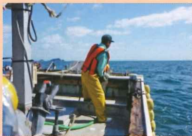
1人乗り漁船で漁業を行っている者