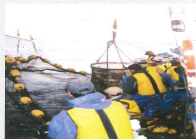
1人乗り以外の漁船で漁業を行っている者