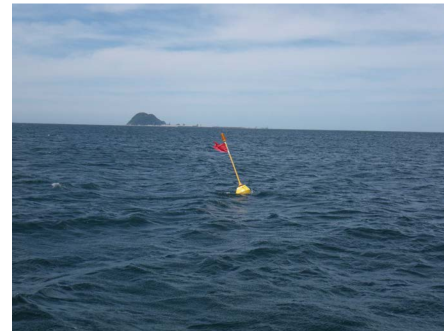
写真-1 ブイ設置状況