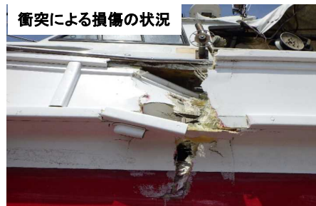
衝突による損傷の状況

漁船B丸は、漁場向け航行中、僚船から前方に船がいる旨無線連絡があり、レーダー及び目視にて確認したところ右前方に船舶を認めたことから、先程連絡にあった前方の船だろうと臆断し、正船首方向にいた漁船A丸に気付くことなく航行し、衝突したもの。