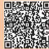
水上オートバイ用