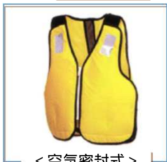
< 空気密封式 >