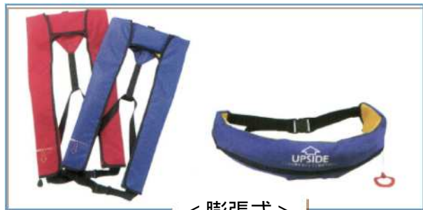
< 膨張式 >

ライフジャケットには、膨張式（首掛けタイプ、ベルトタイプ、ジャンパータイプ、ウェストポーチタイプ）、固形式、空気密封式、そして小児用の4種があります。