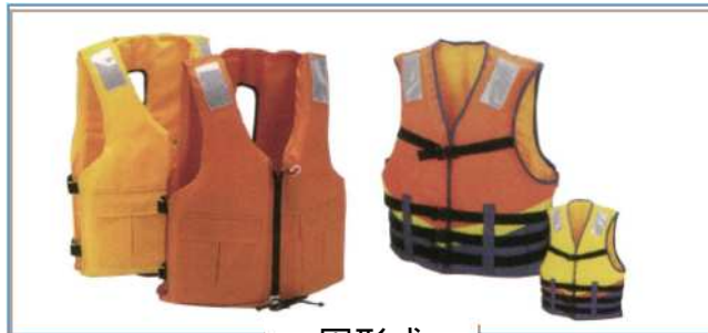
< 固形式 >