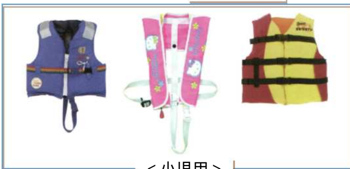
< 小児用 >

固形式、空気密封式、小児用を使用する際には、外観点検を行い適正に装着することで安全に使用することができますが、膨張式はさらに作動部の点検が必要となります。