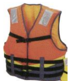
固定式ライフジャケット

磯場で釣りをする場合、膨張式ライフジャケットでは岩やフジツボに引っかかり破損し、膨張しない恐れがあるため、固定式ライフジャケットを着用するようにしましょう。